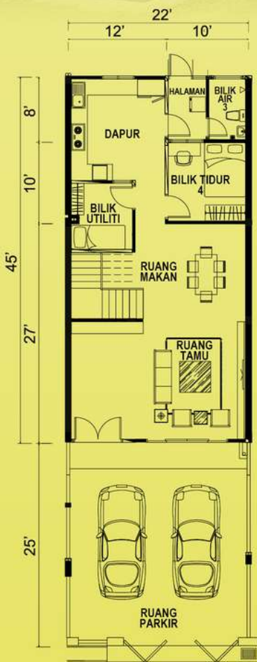
Pelan Tingkat Atas